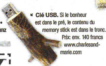
♦ Clé USB. Si le bonheur est dans le pré, le contenu du memory stick est dans le tronc. Prix: env. 140 francs. www.charlesandmarie.com