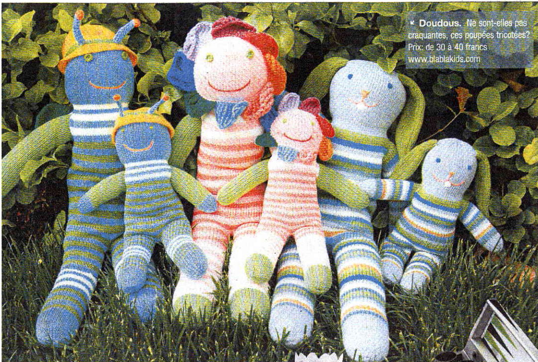
♦ Doudous. Ne sont-elles pas craquantes, ces poupées tricotees? Prix: de 30 à 40 francs. www.blablakids.com