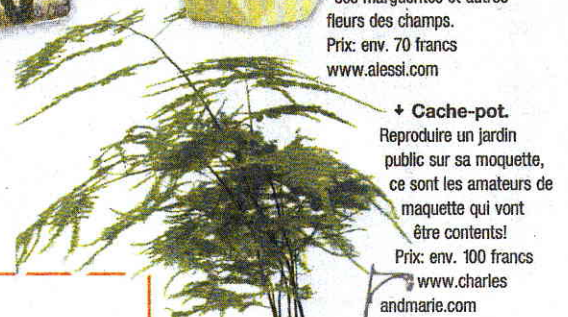
♦ Cache-pot. Reproduire un jardin public sur sa moquette, ce sont les amateurs de maquette qui vont être contents! Prix: env. 100 francs. www.charlesandmarie.com