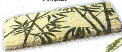
♦ Paillasson bambou. A nouveau printemps, nouvelles chaussures. A nouvelles chaussures, nouveau paillasson. On le choisit alors tendance forêt tropicale. Prix: 17 fr. 90. Chez Interio