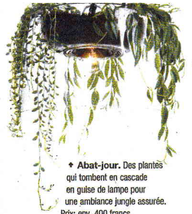
♦ Abat-jour. Des plantes qui tombent en cascade en guise de lampe pour une ambiance jungle assurée. Prix: env. 400 francs. www.pid.se