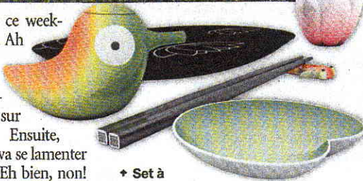
♦ Set à sushis. Sympa, l'oiseau? Il s'agit d'un récipient à sauce de soja de la nouvelle collection «Orientales» d'Alessi. Vite, des sushis! www.alessi.com