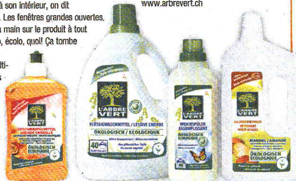
Prix: dès 3 fr. 90. Chez Coop, drogueries. www.arbrevert.ch