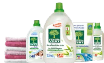
Gamme soin du linge