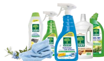
Gamme nettoyeurs ménagers