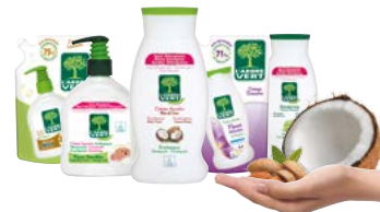
Gamme hygiène corporelle